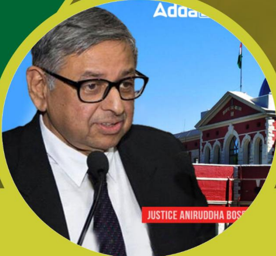
JUSTICE ANIRUDDHA BOSU