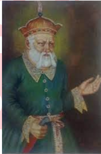
Sultan Quli Qutub Shah (1518 - 1543)

సుల్తాన్ కులీ-కుతుబ్-ఉల్-ముల్క్ (క్రీ.శ.1518-1543)