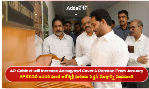
AP Cabinet will Increase Aarogyasri Cover & Pension From January AP కేబినెట్ జనవరి నుండి ఆరోగ్యశ్రీ మరియు పెన్షన్ మొత్తాన్ని పెంచనుంది

వైఎస్ఆర్ ఆసరా, చేయూత పథకాల అమలుకు మరియు జనవరి నుంచి వృద్ధాప్య సామాజిక భద్రత పింఛన్లను రూ.2,750 నుంచి రూ.3,000కు పెంచేందుకు రాష్ట్ర మంత్రివర్గం శుక్రవారం ఆమోదం తెలిపింది. ఆంధ్రప్రదేశ్ ప్రభుత్వం వైఎస్ఆర్ ఆరోగ్యశ్రీ కింద ఉచిత వైద్య చికిత్స పరిమితిని రూ. 25 లక్షలకు పెంచనుంది అదికూడా వార్షిక ఆదాయం రూ.5 లక్షలు ఉన్న వారందరికీ ఇది వర్తిస్తుంది. ఈ చర్యతో దాదాపు 90శాతం కుటుంబాలకు ఖరీదైన వైద్యం అందనుంది. ఈ పథకంలో భాగంగా కొత్త ఆరోగ్యశ్రీ కార్డులను 18వ తేదీన జగన్ మోహన్ రెడ్డి లబ్ధి దారులకు అందజేయనున్నారు. ఆరోగ్యశ్రీ పథకానికి ఏడాదికి రూ.4,400 కోట్లు కేటాయించారు 3,257 జబ్బులకు ఆరోగ్యశ్రీ ద్వారా ఉచితంగా వైద్యం అందించనున్నారు.