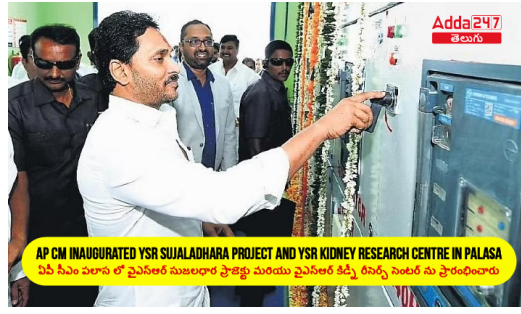
AP CM INAUGURATED YSR SUJALADHARA PROJECT AND YSR KIDNEY RESEARCH CENTRE IN PALASA పసి నీలం లో వైఎస్ఆర్ సుజలధార ప్రాజెక్టు మరియు వైఎస్ఆర్ కిడ్నీ రిసెర్చ్ సెంటర్ ను ప్రారంభించారు

శ్రీకాకుళం జిల్లా మకారాంపురంలో కిడ్నీ బాధితుల సమస్యలని తీర్చడానికి 700 కోట్లతో వైఎస్ఆర్ సుజలధార ప్రాజెక్టుని సీఎం జగన్ ప్రారంభించారు దానితో పాటు పలాసలో వైఎస్ఆర్ కిడ్నీ రిసెర్చ్ సెంటర్, 200 పడకల నూపర్ స్పెషాలిటీ హాస్పిటల్ కూడా ప్రారంభించారు. ఈ చర్యతో శ్రీకాకుళం జిల్లా లో కిడ్నీ వ్యాధుల బారిన పడ్డవారికి మెరుగైన వైద్యంతో పాటు కిడ్నీ సమస్యలు తలెత్తకుండా తాగునీరు కూడా అందుతుంది.