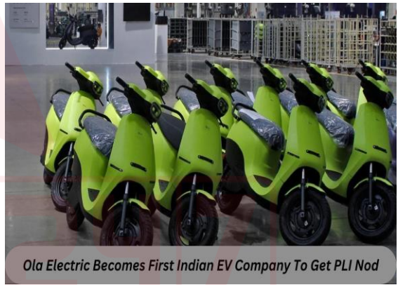
Ola Electric Becomes First Indian EV Company To Get PLI Nod

IPO-బౌండ్ ఎలక్ట్రిక్ స్కూటర్ కంపెనీ అయిన ఓలా ఎలక్ట్రిక్ ప్రభుత్వ ఉత్పత్తి-లింక్డ్ ఇన్వెస్టివ్ (PLI) స్కీమ్‌కు అర్హతను పొందడంతో భారతదేశం యొక్క ఎలక్ట్రిక్ వెహికల్ (EV) ల్యాండ్‌స్కేప్ ఒక సంచలనాత్మక అభివృద్ధిని చూస్తోంది. ఈ ఘనత Ola ఎలక్ట్రిక్‌ను సుస్థిర రవాణా దిశగా పుష్ చేయడంలో కీలక పాత్ర పోషిస్తుంది.