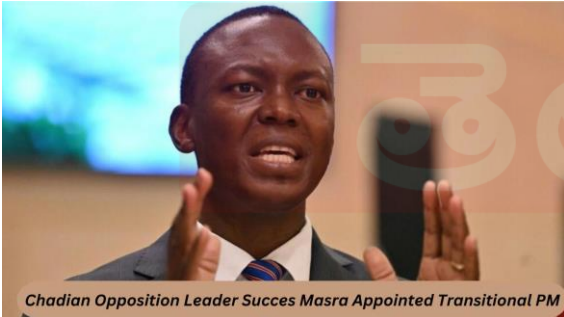
Chadian Opposition Leader Succes Masra Appointed Transitional PM

చైనా ఇటీవల తన కొత్త రక్షణ మంత్రిగా డాంగ్ జున్ ను నియమించింది, ఇది దేశ సైనిక నాయకత్వంలో గణనీయమైన మార్పును సూచిస్తుంది. ఆగస్టులో చివరిసారిగా బహిరంగంగా కనిపించిన తన పూర్వీకుడు లీ షాంగ్సును అధికారికంగా తొలగించిన రెండు నెలల తర్వాత ఈ చర్య జరిగింది. బీజింగ్ లో జరిగిన నేషనల్ పీపుల్స్ కాంగ్రెస్ స్టాండింగ్ కమిటీ సమావేశంలో ఈ నిర్ణయం యొక్క వ్యాహాత్మక ప్రాముఖ్యతను హైలైట్ చేస్తూ ఈ ప్రకటన చేశారు. 62 ఏళ్ల డాంగ్ గతంలో 2021 ఆగస్టు నుంచి నేవీ కమాండర్గా పనిచేశారు. చాడియా ప్రతిపక్ష నేత సక్సెస్ మస్రా తాత్కాలిక ప్రధానిగా నియమితులయ్యారు.